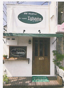
(山陽電車 月見山駅改札口出すぐ)